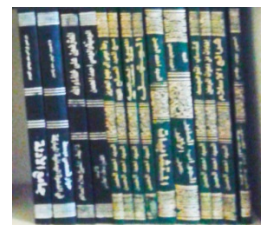
colección de libros escritos por el Sayed Ahmad Al-Hasan salamullah alaih