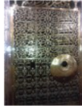
Jaula dorada que rodea la tumba del Mensajero Muhammad (sws) en Medina Al Munawwarah

Autor de libros tales como “El Camino del Llamado del Yamani”