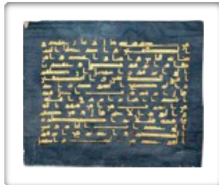
Representación en color de una de las copias más antiguas de las páginas del código uzmánico del Corán

Autor de decenas de libros tales como 'Al-Balag Al-Mubin' y '40 Hadices en Al-Mahdis'. Fue uno de primeros creyentes en el sagrado dawa