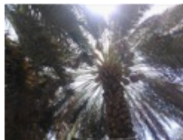
Foto tomada en una granja de Qatif de algunas datileras

Es uno de los primeros creyentes en el llamado del Yamani (as)