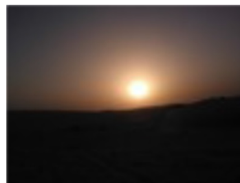
Foto tomada en el desierto de Qatif durante el Ramadán de 1434 justo antes del Salat Al Magrib

Autor de varios libros tales como “Al-Mutaharath Fil Aqida Al-Masihyya” y “Youm Al-Jalas”. También escribe en el periódico Sirat Al Mustaqim