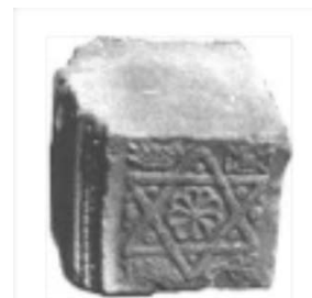
Estrella de David hallada en Iraq en una pieza de albañilería.

En el 2002 fue capturado por los hombres de Saddam y torturado junto con muchos otros.